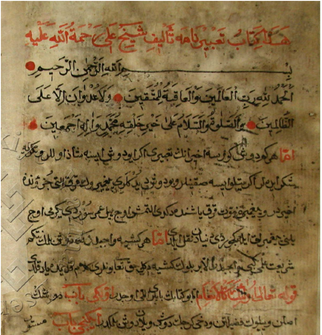
Resim 1. Yazar Şeyh Ali'nin de adının geçtiği eserin ilk sayfasından bir kısım [1b]